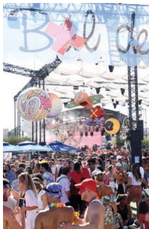
Bal des fous