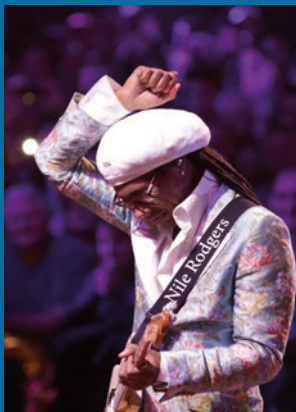
Nile Rodgers & Chic