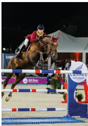
Jumping international de Cannes