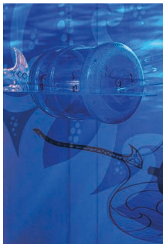
Mathieu Vouzeaud - Fair manta

L'exposition propose des œuvres et des installations immersives réalisées à partir de matériaux recyclés et inspirées notamment par les îles de Lérins. Le visiteur découvrira ainsi la culture d'Aotearoa, la Nouvelle-Zélande, les collections océaniques cannoises et l'histoire