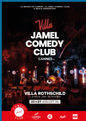
Jamel Comedy Club