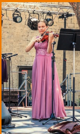
Suquet des arts