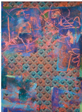
Julien Des Monstiers, Fantômes II, 2020, huile sur toile