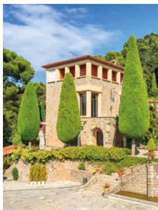
Visites de la Villa Domergue