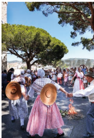
Fête de la Saint-Sauveur