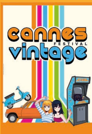
Cannes Festival Vintage