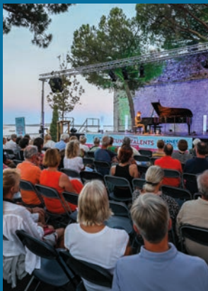
Festival Jeunes talents